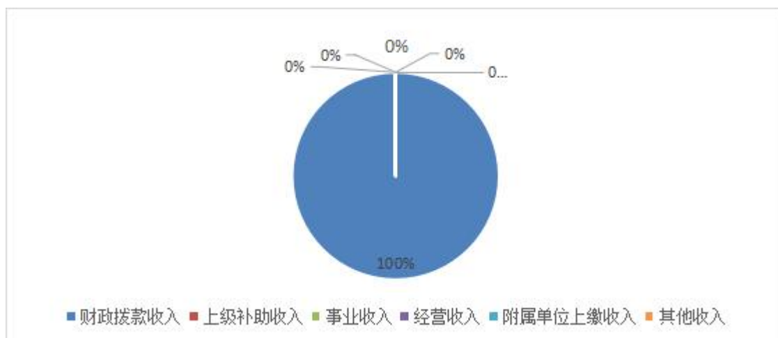
图 2: 收入决算结构